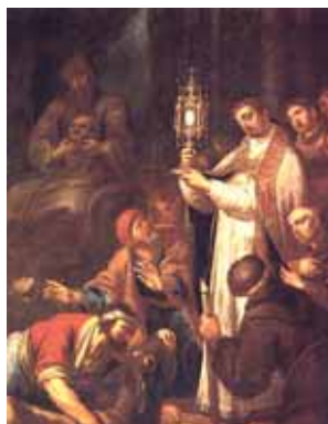
Milagro Eucarístico de San Antonio, Salvaterra de Magos, Iglesia Matriz-Portugal