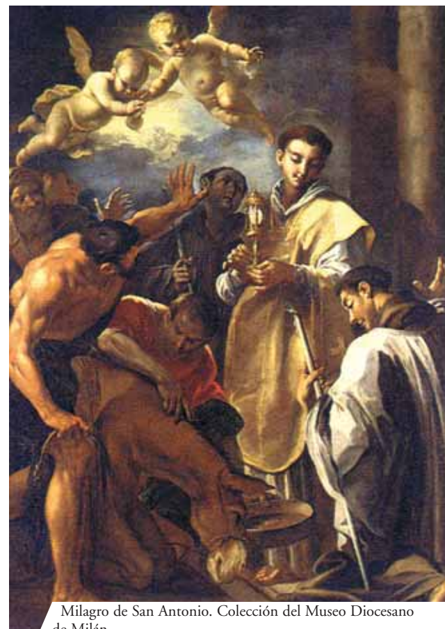
Milagro de San Antonio. Colección del Museo Diocesano de Milán

En la ciudad de Rimini, aún hoy es posible visitar la iglesia erigida en honor al Milagro Eucarístico obrado por San Antonio de Padua en el año 1227. Este episodio está citado en la Begninitas , obra considerada una de las fuentes más antiguas de la vida de San Antonio. “Este Santo hombre discutía con un hereje que estaba contra el sacramento de la Eucaristía y a quien el Santo lo había casi conducido hacia la fe católica. Pero este hereje, después de varios y numerosos argumentos declaró: “si tú, Antonio, logras demostrarme con un prodigio que en la Comunión está realmente el Cuerpo de Cristo, entonces yo, después de haber renunciado totalmente a la herejía, me convertiré inmediatamente a la fe católica. ¿Por qué no hacemos una apuesta? Tendré encerrada por tres días una de mis bestias y le haré sentir el tormento del hambre. Luego de tres días, la traeré aquí, delante