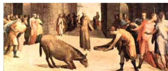
Domenico Beccafumi, San Antonio y el Milagro de la mula (1537), Louvre, París