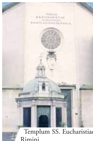
Templum SS. Eucharistiae, Rimini