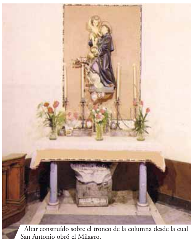
Altar construido sobre el tronco de la columna desde la cual San Antonio obró el Milagro.